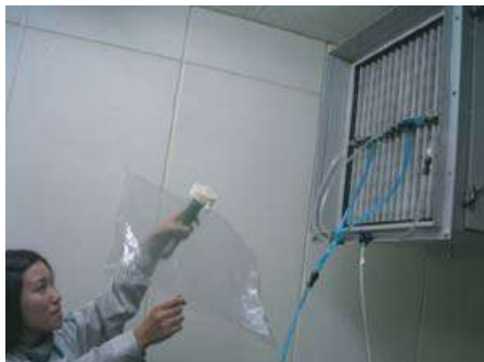
スプレーテスト臭気採取