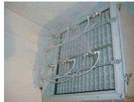
排気口ノズル設置部