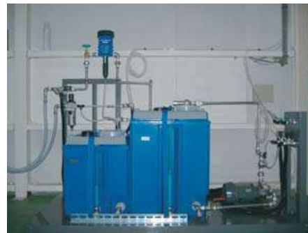
マイクロゲルスプレーユニット