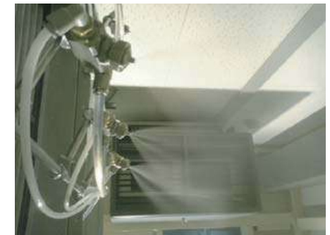
スプレー噴霧ミスト