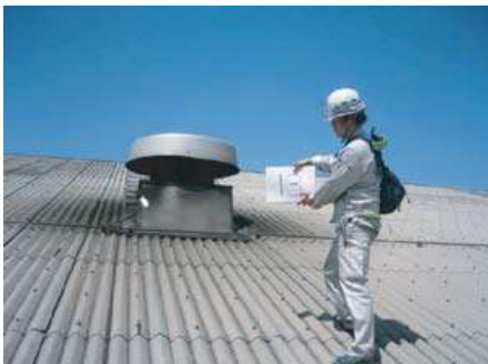
コンサルテーション