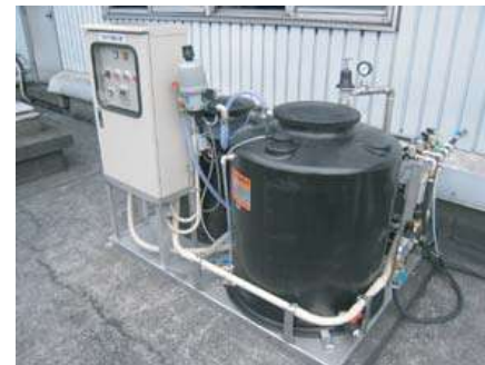
マイクロゲルスプレーユニット