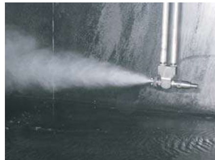
ダクト内スプレー噴霧