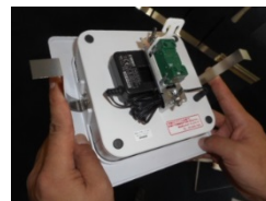
【板バネの押さえ方】

本体と天井材は必ず2~5mmの隙間をあけてください。 ※本体の着脱が出来なくなります。